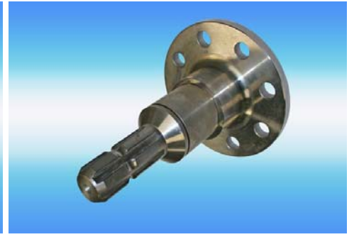
Mehrkeilwelle sogenannte Steckwelle